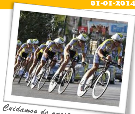
Cuidamos de nuestros federados

La compañía conforme a las coberturas existentes en la póliza contratada, procederá a determinar la existencia, o no, de responsabilidad imputable al federado implicado en los hechos, siempre y cuando